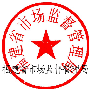
福建省市場監督管理局