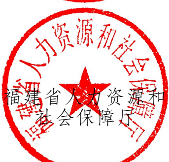
福建省人力資源和社會保障廳