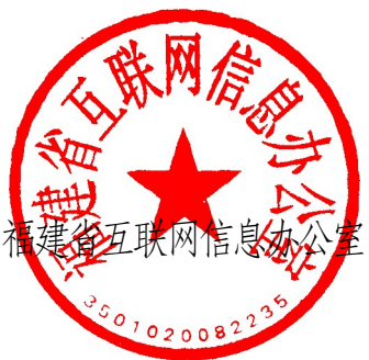
福建省互聯網信息辦公室