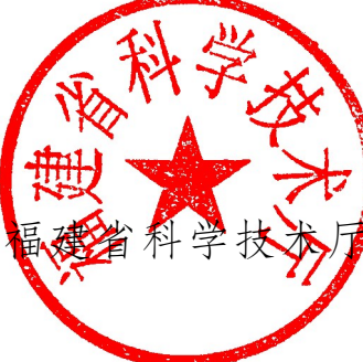
福建省科學技術廳