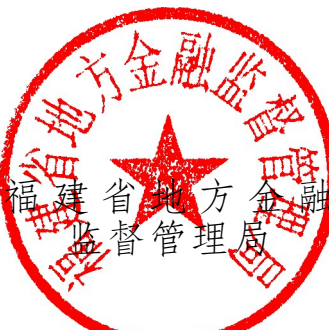
福建省地方金融監督管理局