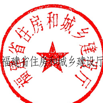
福建省住房和城鄉建設廳