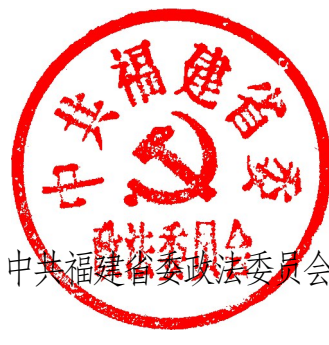
中共福建省委政法委員會