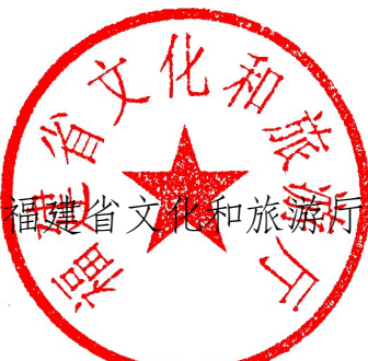
福建省文化和旅游廳